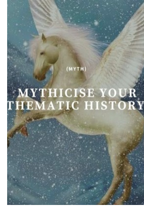
En çok oy alan poster