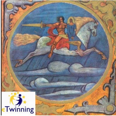
En çok oy alan logo